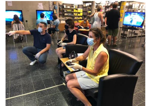
Gaming- und Coding-Workshop