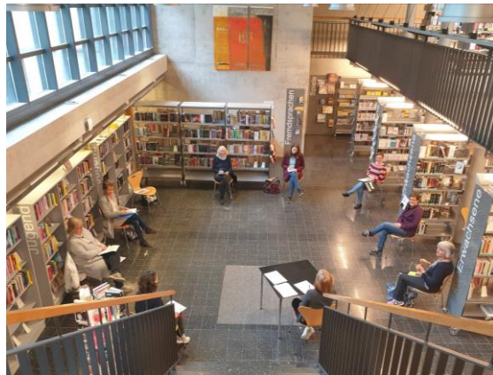
Teamsitzung zu «Corona-Zeiten»