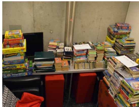
Medien in Quarantäne