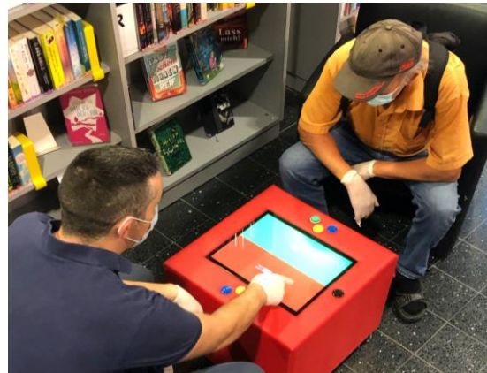
KUTI-Würfel zu Besuch