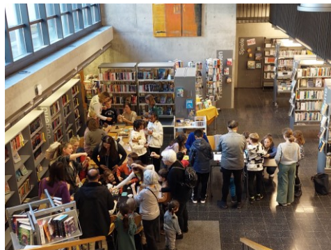
Engelbasteln für den Weihnachtsbaum