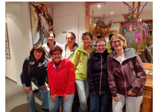
Teamausflug nach Hofstetten