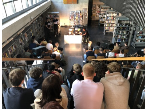
Theaterprojekt von der WMS